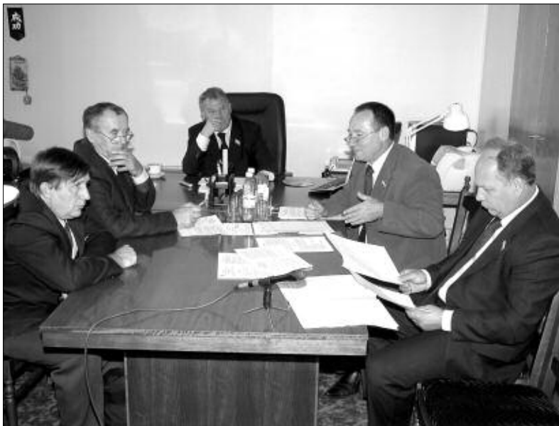
На заседании комиссии по молодежной политике.

На 1 декабря из перечня наказов избирателей выполнены следующие: