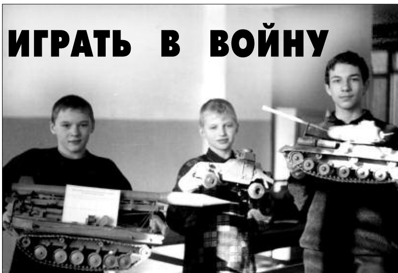
Макеты военной техники, сделанной руками ребят.

— Привели меня в кружок друзья, когда мне было лет девять, теперь уже шестнадцать, так что я ветеран, можно сказать. Сейчас учусь в монтажном техникуме на втором курсе. Мне сразу понравился мир машин. Я научился работать с чертежами, различными инструментами, паять, зачищать. У нас в мастерской есть несколько станков: фрезерный, токарный, сверлильный, заточный и мальчишки, как заправские мастера, управляют со сложной техникой.