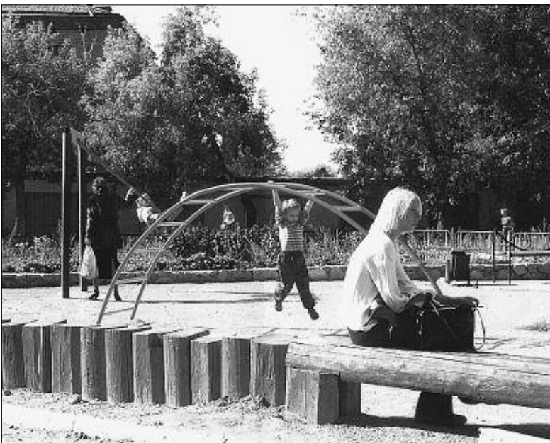
На этом месте хотели построить дом.