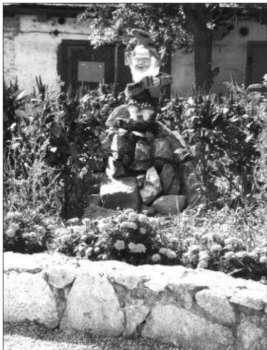
Зеленый уголок «Веселый гномик».

— Думаю, да. Каждое мелкое, казалось бы, дело, является частью общей большой картины. Но все же судить не мне, а избирателям. А пока они судят, мы работаем... Для детей, по просьбам родителей, обустроиваем детские площадки и спортивные сооружения. Недавно помешали точечной застройке — на Красном проспекте вместо детской площадки во дворах домов №№ 159, 161, 161/1, 163 хотели построить высотный дом. Жители обратились к нам, и мы занялись решением этого вопроса. Теперь там прекрасное место для отдыха и хоккейная коробка. Летом ре-