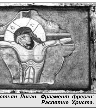
Себастьян Ликан. Фрагмент фрески: Распятие Христа.

Цирк ул. Челюскинцев, 21. Тел. 20-46-70. Цирк на воде «Водная феерия». Если вы любите смеяться, сопереживать, восхищаться и удивляться, то новая программа цирка на воде «Водная феерия» — это зрелище для вас. Магический сплав музыки, искрометного цирка, хореографии в воде, сказочного света, ликования фонтанов в шикарном художественном оформлении с первых же минут погружает вас в необыкновенную атмосферу фантастического мира. Этот мир наполнен мифическими существами, то летающими в воздухе, то плавающими и ныряющими в воде, то прыгающими по островкам в фонтанах огня и воды. Здесь трудно осознать, где живые существа, а где образы, созданные артистами.